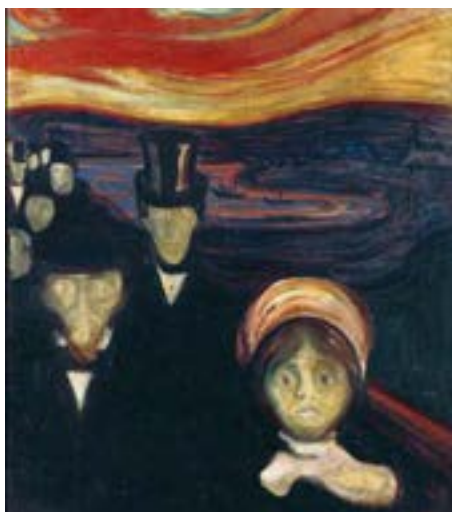
Die Angst, von Edvard Munch, 1894

Aber Grund zur Angst haben nicht nur ältere Leute, sondern auch junge Menschen. Wie könnte es anders sein, wenn es in der