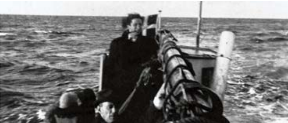
Juden auf der Flucht von Dänemark nach Schweden, 1943

Aus dem Lager Froslev wurde am Kriegsende ein Internierungslager für Landesverräter, Kriegsverbrecher und Angehörigen der deutschen Minderheit, später eine Kaserne; ein Teil ist heute ein Museum.