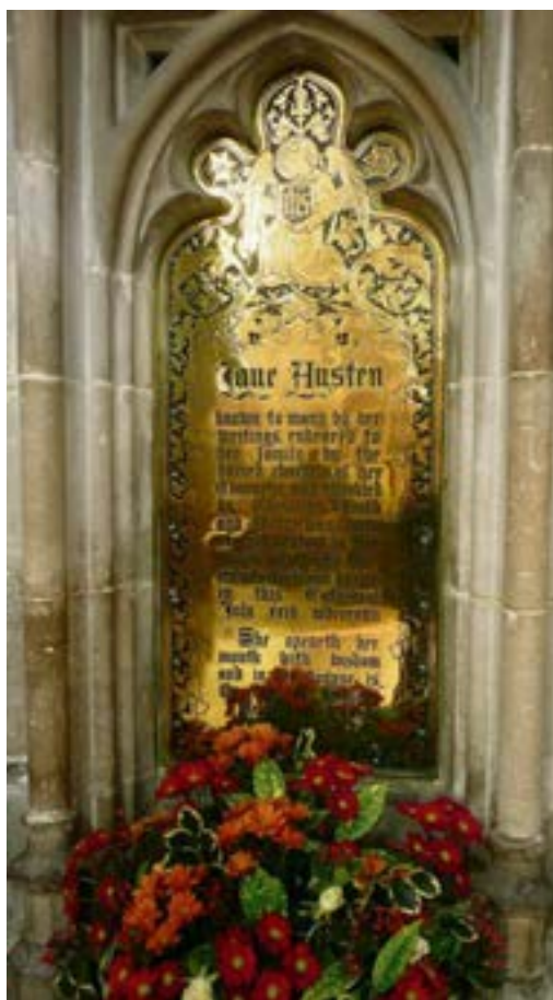
Brass Memorial by James Wyatt (1870), near Jane Austen's grave in Winchester Cathedral

Even more importantly, Jane Austen was a writer who wanted to be published, and husbands generally didn't approve of wives earning a living. At twelve she'd already started working towards this ambition, her sense of the ridiculous and people's hypocrisy inspiring her with her Juvenilia . These are short, hilarious pieces of fiction that gleefully lampoon the worst aspects of human nature and life in the eighteenth century. Her adult writing continued to mock the pretentious and ignorant but it was mostly carefully disguised in romance and humour. But, nevertheless, her „three or four families in a village“* reflect most of society's ills, and the „little piece of ivory“* on which she based her plots demonstrates the depth of her understanding of human nature. We all know some of the characters she depicts and although she makes us laugh at them, she never ignores their selfish, callous behaviour: even the saints are shown as less than lovable. Elizabeth Bennet's words in Pride and Prejudice : „There are few people whom I really love, and still fewer of whom I think well“, speak for Jane herself and her opinion of the human race. „The British people may smile and insist