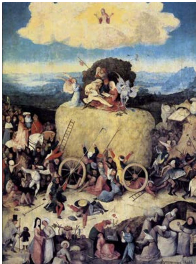
Jérôme Bosch: La vie est comme un chariot de foin, chacun en prend ce qu'il peut

Autre exemple, plus près de chez nous, d'élections démocratiques dont le résultat a été considéré comme inacceptable par „nos pays démocratiques“. Il s'agit de la Grèce et des trois élections consécutives de 2015 (2 élections parlementaires et un référendum), tous les trois refusant clairement la politique ridicule et meurtrière imposée depuis 2010 par la „troïka“, c. à d. les institutions que sont la Commission européenne, la Banque centrale européenne et le Fonds monétaire international. Il faut croire que l'objectif premier de „nos pays“ était de se débarrasser au plus vite de ce gouvernement de gauche, gouvernement qui faisait tellement contraste dans