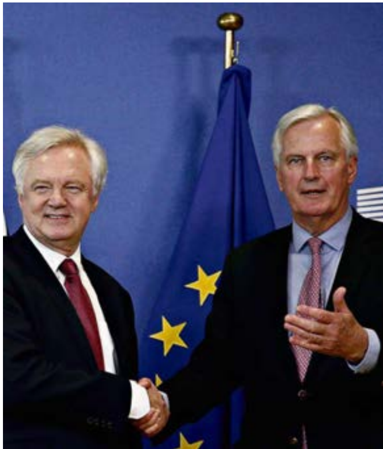
David Davis und Michel Barnier am Anfang der Brexit-Verhandlungen

Im Mai hielt Barnier in Malta eine Rede vor der „Versammlung der Europaausschüsse der nationalen Parlamente“ (COSAC). Bar-