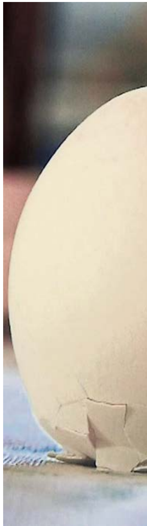
Das Ei des Kolumbus: Schöne neue Welt auf einem Scherbenhaufen

Und die Sozialdemokraten diesseits des Atlantiks sollten nicht vergessen, dass der mit vielen Vorschusslorbeeren überschüttete Macron sich in dieser Camera obscura bestens auskennt. Vogelfreie, will sagen schwer kontrollierbare Herren sind sie allemal . . .