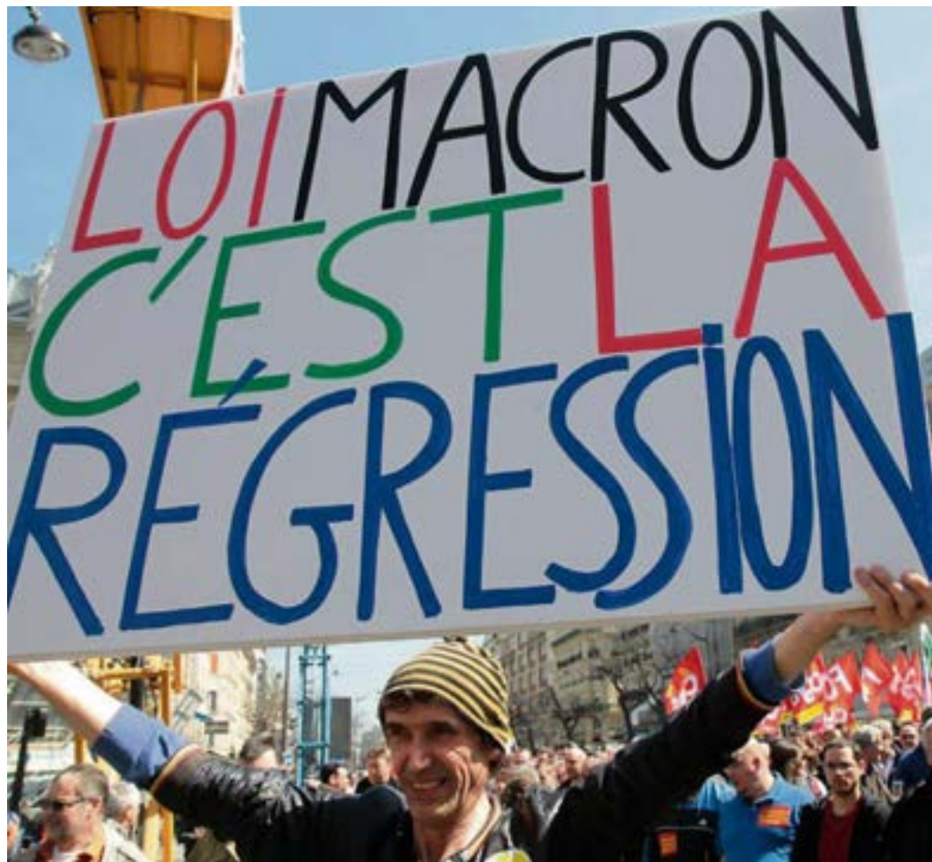
Paris, le 9 avril 2014 manifestation intersyndicale contre la politique d'austérité, la loi Macron

Si les institutions de la Ve République ont pu s'adapter depuis 60 ans à de nombreuses convulsions politiques et sociales, elles imposent la présence d'un président