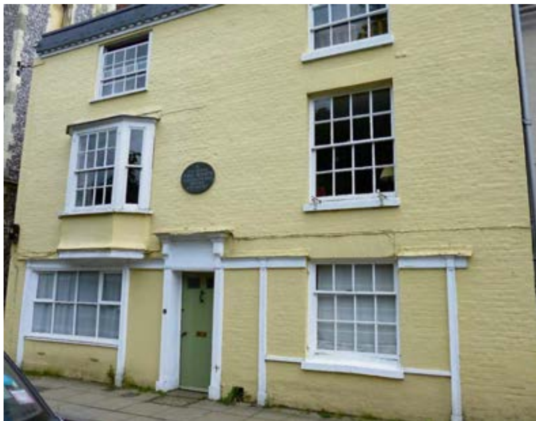
No. 8, College Street, Winchester, where Jane Austen died on 18 July 1817