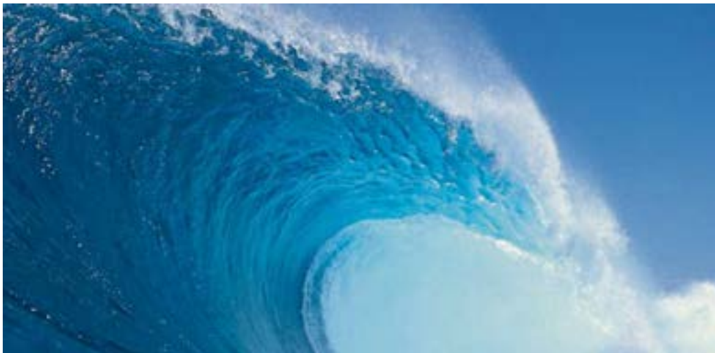
Bankierswelle wurde zum Spekulationstsunami

festgestellt werden kann. Dazu braucht es den Vizepräsidenten und eine Mehrheit der Minister (secretaries).