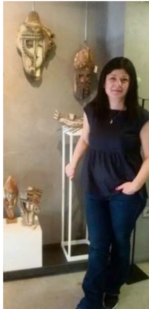
„Die Künste machen die Seele glücklich“