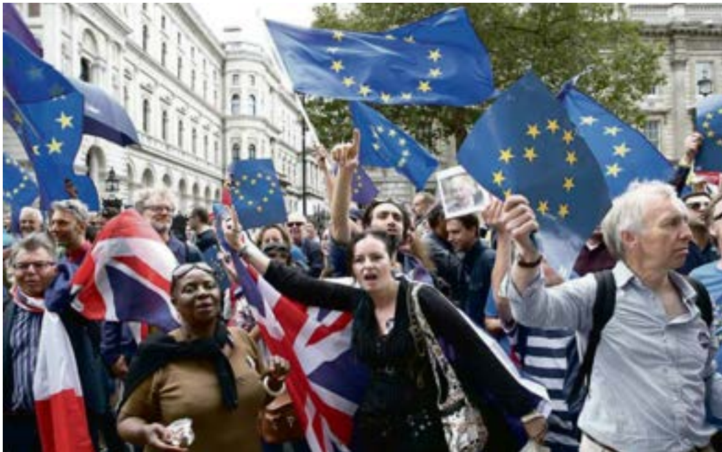
Anti-Brexit Protest in London