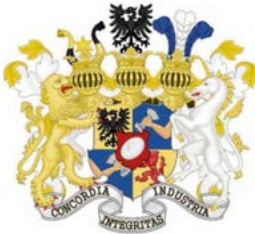
Das Ethos derer von Rothschild: Eintracht, Redlichkeit und Fleiß

poujadistischem Niveau von Kolonialwarenhändlern abspielt, scheint, wie in der ersten Hälfte des vergangenen Jahrhunderts, das Recht des Stärkeren die Stärke des Rechts wieder einmal abgelöst zu haben. Doch obwohl ihre Führer sich auf Augenhöhe wähnen, verfügen die USA mit 600 Milliarden Dollar über den zehnfachen Abwehrhaushalt der Russen.